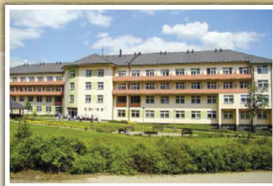
Sociální služby města Havlíčkova Brodu – Domov pro seniory Reynkova 3643, 580 01 Havlíčkův Brod

Kritéria pro přijetí a „pořadník“ – o pořadí zájemců o službu rozhoduje jejich aktuální sociální situace. Ta je posuzována podle kritérií odrážejících zejména soběstačnost osob v základních činnostech služby domova pro seniory. To znamená, že první v pořadí je vždy člověk nejvíce odkázaný na pomoc služby.