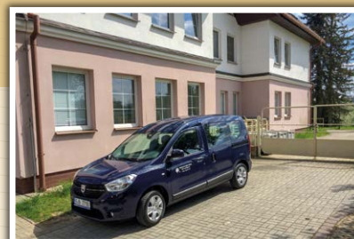
Sociální služby města Žďár nad Sázavou – Pečovatelská služba Okružní 67, 591 01 Žďár nad Sázavou

Pravidelná setkávání uživatelů – každoročně se účastníme setkání seniorů žďárského okresu a jednou za čtyři roky toto setkání sami pořádáme.